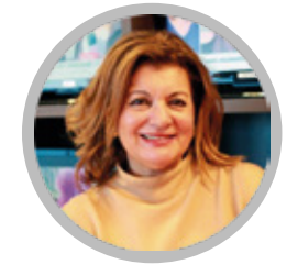
Carmen Amores DIRECTORA GENERAL CASTILLA-LA MANCHA MEDIA